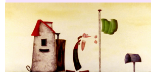
Antipoden © Frodo Kuipers