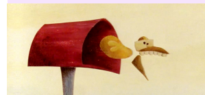
Antipoden © Frodo Kuipers