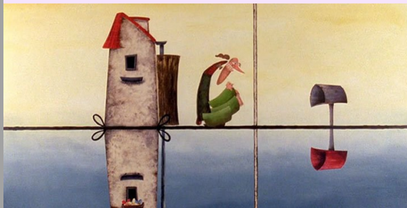
Antipoden © Frodo Kuipers

Titre Antipoden Thème Antipodes Genre et mots-clés Comique, univers parallèle, univers miroir, absurde. Cycle (pour le film) 2, 3 Durée 08 min 54 s Réalisation Frodo Kuipers Musique Jan Brock & De Elmo's Production KASK Hogeschool Ghent (Pays-Bas, 2001)