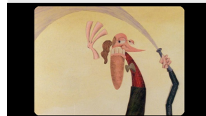
Antipoden © Frodo Kuipers