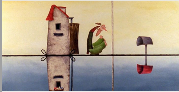
Antipoden © Frodo Kuipers

Titre Antipoden Thème Antipodes Genre et mots-clés Comique, univers parallèle, univers miroir, absurde. Cycle (pour le film) 2, 3 Durée 08 min 54 s Réalisation Frodo Kuipers Musique Jan Brock & De Elmo's Production KASK Hogeschool Ghent (Pays-Bas, 2001)