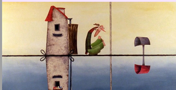
Antipoden © Frodo Kuipers

Titre Antipoden Thème Antipodes Genre et mots-clés Comique, univers parallèle, univers miroir, absurde. Cycle (pour le film) 2, 3 Durée 08 min 54 s Réalisation Frodo Kuipers Musique Jan Brock & De Elmo's Production KASK Hogeschool Ghent (Pays-Bas, 2001)