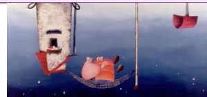
Antipoden © Frodo Kuipers

Il veillera aussi à leur exposer l'objectif d'apprentissage du jeu (réunir des mots contraires). Une fois, les parties en cours, l'enseignant circulera dans les différents groupes pour observer et étayer les élèves si besoin. A la fin de la séance, un temps de verbalisation sur l'activité sera proposé pour que les élèves reformulent ce qu'ils ont appris et partagent leurs ressentis.