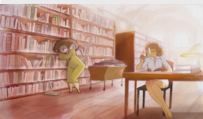
Le complexe du hérisson