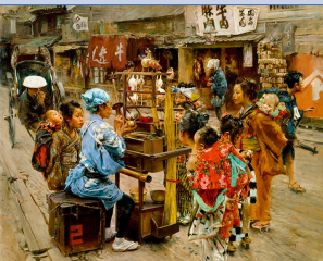
The Ameya (marché des confiseries), Robert Frederick Blum (1893)

On pourra alors leur proposer de mettre en place un marché des connaissances. Ce marché est une sorte de kermesse dans laquelle les élèves proposent une activité que les autres élèves vont pouvoir découvrir et apprendre. Ils sont 100% acteurs et doivent tout préparer. Il va falloir choisir ses partenaires, l'activité, lister le matériel nécessaire. Les élèves vont devoir s'organiser et coopérer afin de mettre en place leur stand. Définir précisément ce qui sera présenté, proposé, le temps que cela prendra. De quel matériel ils auront besoin. Leur demander de faire une affiche à destination des visiteurs. Durant toutes ces étapes, l'enseignant va aider, corriger, s'assurer que l'activité est réalisable. Cette préparation sera l'occasion de travailler dans différentes disciplines. Le jour du marché, les élèves vont s'entraider pour installer. Puis viendra le moment tant attendu où ils vont pouvoir montrer leurs