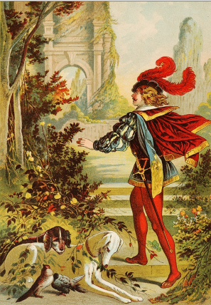
La Belle au bois dormant. Illustration : Carl Offerdinger, 19 ème siècle. CCO